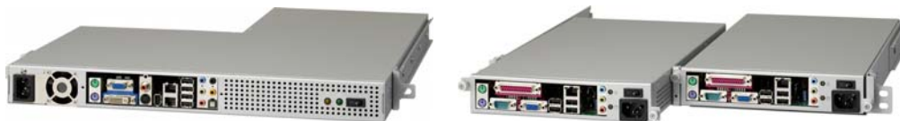
1U ハーフL型サーバ (左) / 1U クォータサーバ (右)

また、2009年には、1Uラックマウントサイズを前後に2分割して、通常1台のスペースに2台のサーバを実装する1UハーフL型サーバと、前後+左右に4分割して4台のサーバを実装する1Uクォータサーバを新たに開発。1Uクォータ型には省電力CPUであるインテル® Atom™プロセッサを採用し、筐体の小型化とサーバの消費電力および発生する熱を大きく抑制、従来の1ラック72台から約2倍の最大160台もの高収容を実現いたしました。