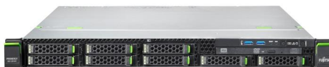
Fujitsu 「PRIMERGY RX2530 M1」

※サーバモデル Fujitsu 「PRIMERGY RX1330 M1」は、2015 年 11 月 4 日からご提供となります。