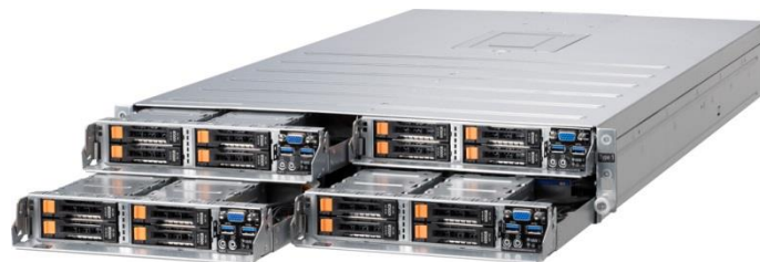
NEC 「Express5800 E120f-M」

「パフォーマンスシリーズ」では、スケールアップを見越したサービスに適した NEC 「Express5800 E120f-M」を採用し、CPU 最大 6Core×2、メモリ最大 256GB まで搭載可能な高スペックサーバをご提供いたします。ストレージは「SATA」「SAS」「SSD」のラインアップに加え、PCIe Flash ストレージとして「Intel DC P3700」をご利用いただけます。