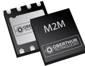
チップ型 SIM (MFF2) (サイズ:MFF2 規格 6mm×5mm)