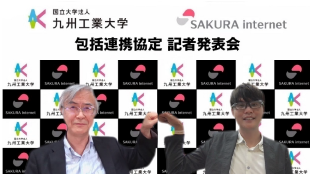
2021年8月30日にオンラインで開催した包括連携協定調印式の様子

本協定は、それぞれ実施する研究開発や教育などの活動を連携して行うことで、学術の発展や新技術の創出、および社会をリードするIT人材の育成に取り組むことを目的としています。