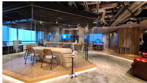
現大阪本社のコミュニケーションスペース

沖縄 DX 拠点は業務を行う場所ではなく、社内外におけるリアルコミュニケーションスペースとしての活用や DX 人材の採用および育成の場としての活用を想定しています。これは当社が実施している「オープンイノベーションを起こすための取り組み」の一環です。