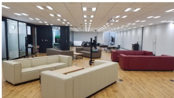
現東京支社のコミュニケーションスペース

クラウドコンピューティングサービスを提供するさくらインターネット株式会社（本社：大阪府大阪市、代表取締役社長：田中 邦裕、以下さくらインターネット）は、沖縄県那覇市にカスタマーサクセスを実現する DX 拠点（以下、沖縄 DX 拠点）の新設を決定いたしました。