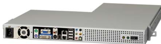
1U ハーフ L 型サーバ

サーバのラインナップには、当社が自社開発したオリジナルの 1U ハーフ L 型サーバを採用し月額の利用料金を大幅に抑えました。既存サービスである「専用サーバ Platform」と「専用サーバ Platform St」を比較した場合、初期費用と月額料金を加算した初年度 1 年間でも 25%～55%程度割安な料金設定となっています。サーバにはインテル®Core™2 Duo やデュアルコア インテル®Xeon®プロセッサを搭載し、CentOS や Red Hat Enterprise Linux、Microsoft Windows Server をシステム要件に応じて選択することが可能です。これにより、機器を購入することなく初期投資額を抑え、サービスのスタートアップが容易になります。