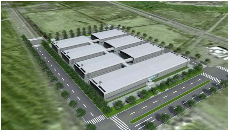
全体図（最終8棟：合計4,000ラック）