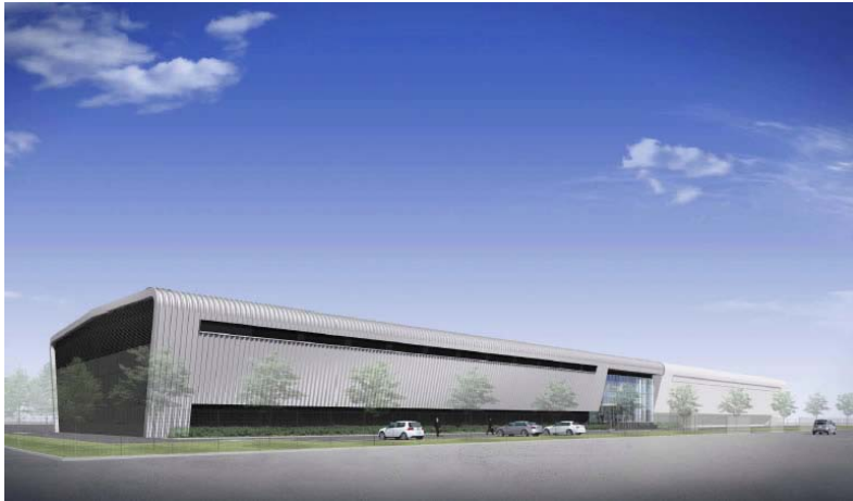
外観図（1期棟：500ラック）