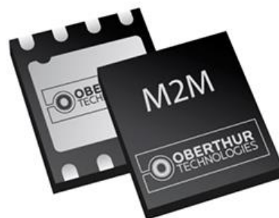
チップ型SIM (MFF2) (サイズ：MFF2規格6mmx5mm)