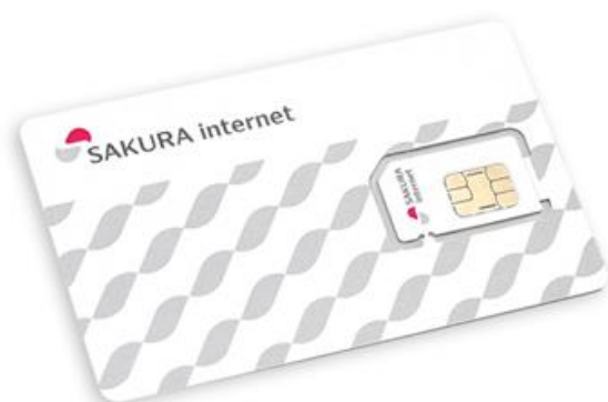
マルチサイズSIM (標準 SIM/microSIM/nanoSIM)