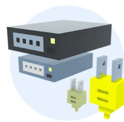
全モデルでの電源と ネットワークスイッチ冗長化