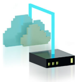
仮想サーバサービスなどとの連携可能