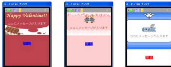
デコメールテンプレート一例

提供デコメールテンプレートを 23 種類から約 100 種類へと大幅に増量いたしました。